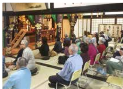
倉蔵寺で 座禅を体験

今回は名誉院長はじめ、介助のための職員9名、患者さんおよびご家族23名が参加しました。