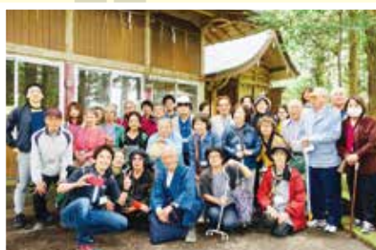
神秘的な空間が広がった 三郎神社で記念撮影