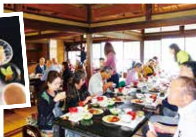
昼食では、地元の野菜や 山菜を使ったお料理を味わい