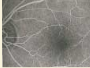
正常な眼底の血管