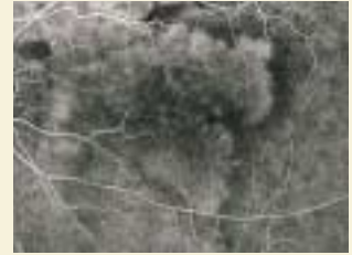
異常 血管の破損により、造影剤の漏出が認められる。